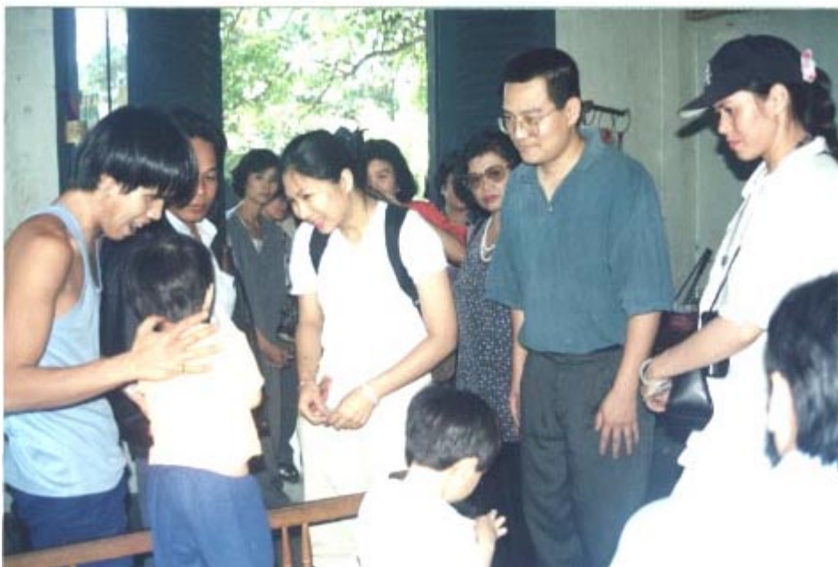
Đức Thầy và các pháp hữu đang thăm viếng và tặng quà cho các gia đình neo đơn.

Nam Mô Đại Thừa Liên Hoa Hóa Thân Minh Vương Phật.